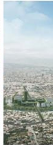
TIRANA MASTERPLAN TIRANA, ALBANIA