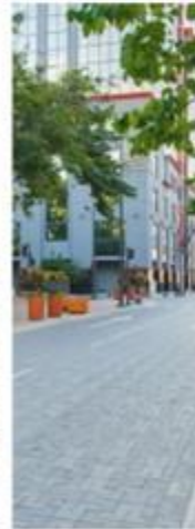
REGENERACION PORTO VIEJO BARCELONA, SPAIN