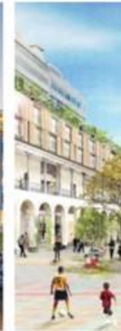
URBAN ECOSYSTEM CUENCA, ECUADOR