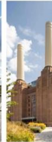
BATTERSEA POWER STATION LONDON, UK