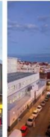
MERCADO DE MELILLA MELILLA, SPAIN