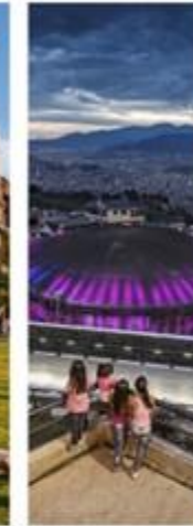
LIFE ARTICULATED UNITS MEDELLIN, COLOMBIA