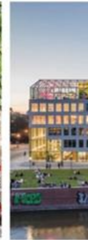
CONCORDIA DESIGN WROCLAW, POLAND