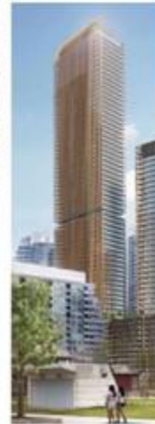
QUEEN'S QUAY WEST TORONTO, CANADA