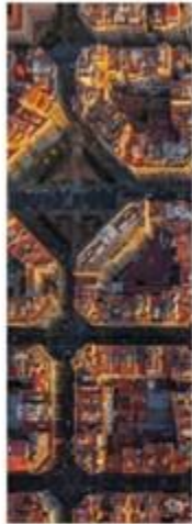
SUPER BLOCKS BARCELONA, SPAIN