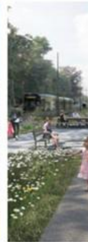
BOULEVARD BRUSSELS, BELGIUM