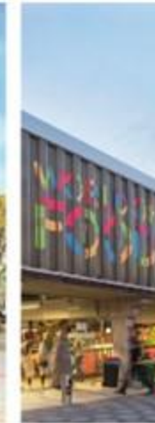
WORLD OF FOOD AMSTERDAM, NETHERLANDS