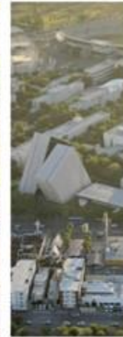
DISTRITO TEC MONTERREY, MEXICO