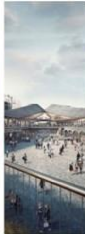
KING'S CROSS LONDON, UK