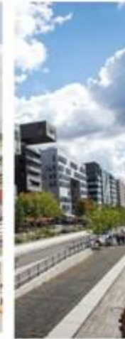
LYON CONFLUENCE LYON, FRANCE