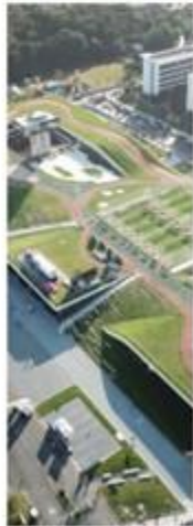
EXHIBITION CENTER HANGZHOU, CHINA