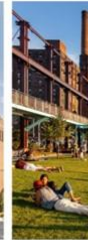
DOMINO PARK NEW YORK CITY, USA