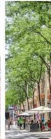
MARIAHILFER STRASSE VIENNA, AUSTRIA