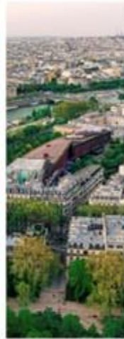
15-MINUTE CITY PARIS, FRANCE