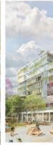
CUENCA RED CUENCA, ECUADOR