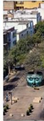
PASEO FRAY ANTONIO GUADALAJARA, MEXICO