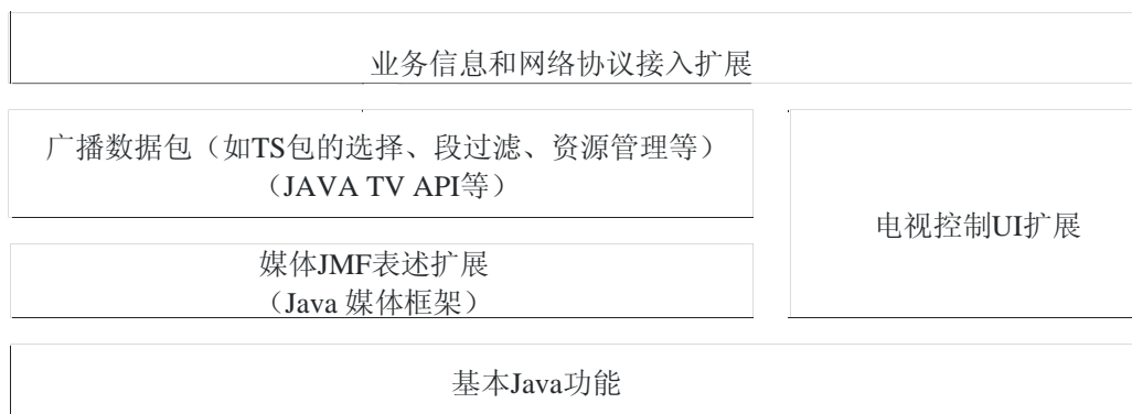
图 2 执行引擎结构