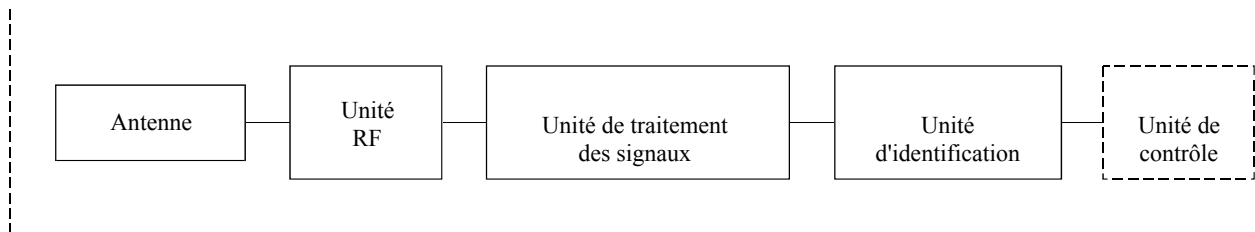
FIGURE 2 Configuration d'un radar automobile

La Fig. 2 illustre la configuration d'un radar automobile.