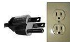
Tipo B, NEMA 5, 3 polos.