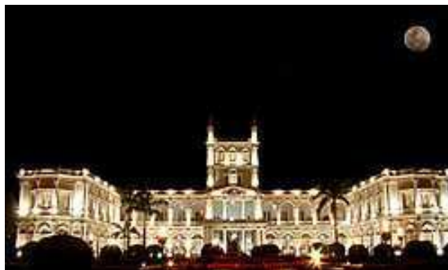
Palacio de los López