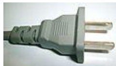
Tipo A, NEMA 1, de 2 polos.