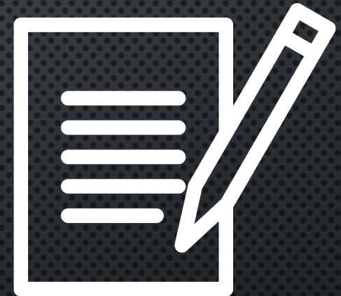
CONTRACT TERMS & CONDITIONS