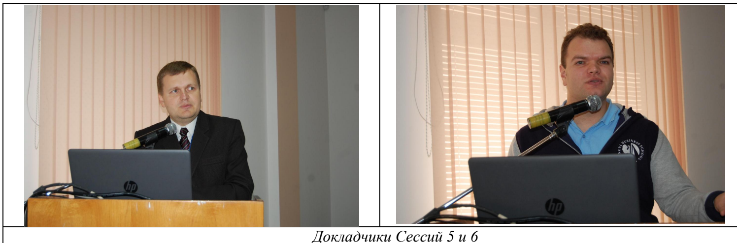
Докладчики Сессий 5 и 6

Также в этот день (19 октября 2018) состоялся круглый стол «Перспективы развития электронного здравоохранения» (модератор – Пётр Воробиенко) в рамках которого были выработаны выводы и рекомендации семинара.