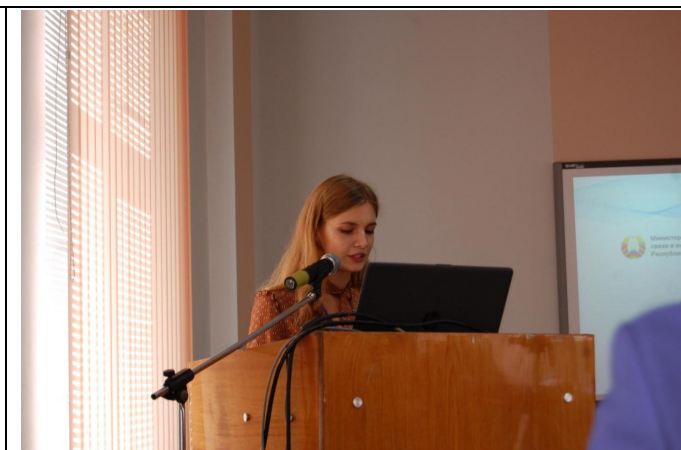
Докладчики Сессии 1