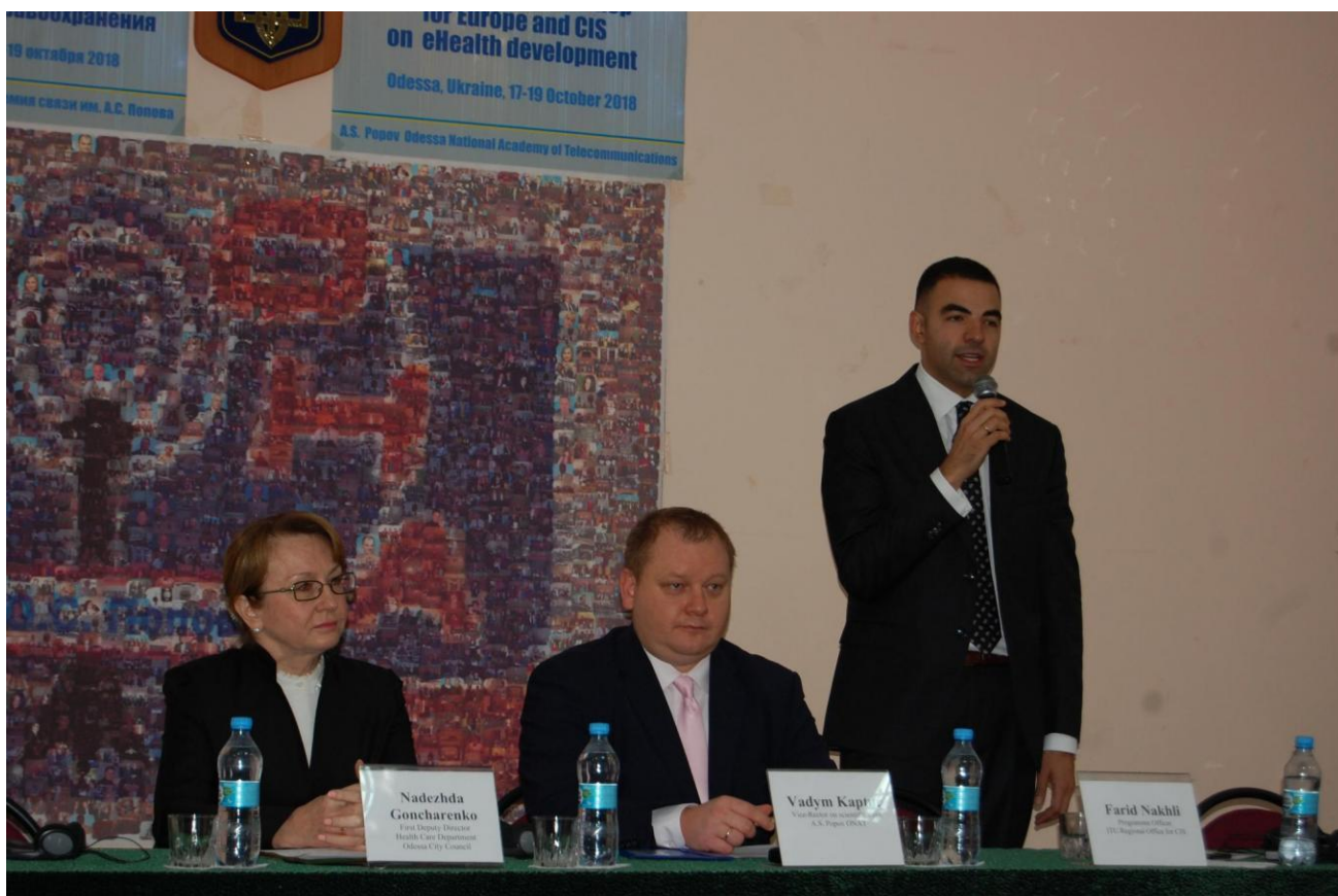
Торжественное открытие семинара

Также с видеообращением выступил Директор Бюро стандартизации электросвязи МСЭ Чхе Суб Ли .