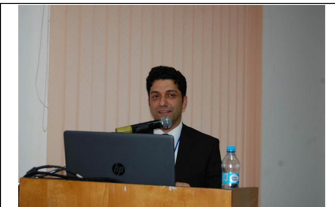
Докладчики Сессии 2

В рамках второго дня работы (18 октября 2018) было заслушано 8 докладов в рамках двух сессий: