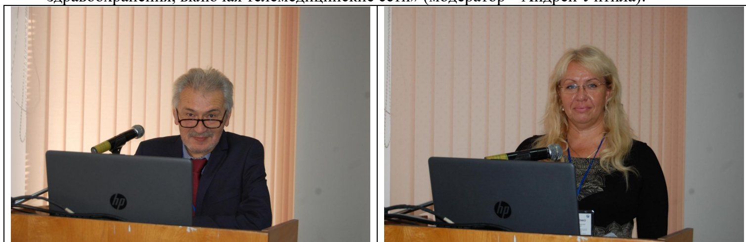
Докладчики Сессии 4

– Сессия 4 «Актуальные проблемы проектирования систем электронного здравоохранения, включая телемедицинские сети» (модератор – Андрей Унтила):