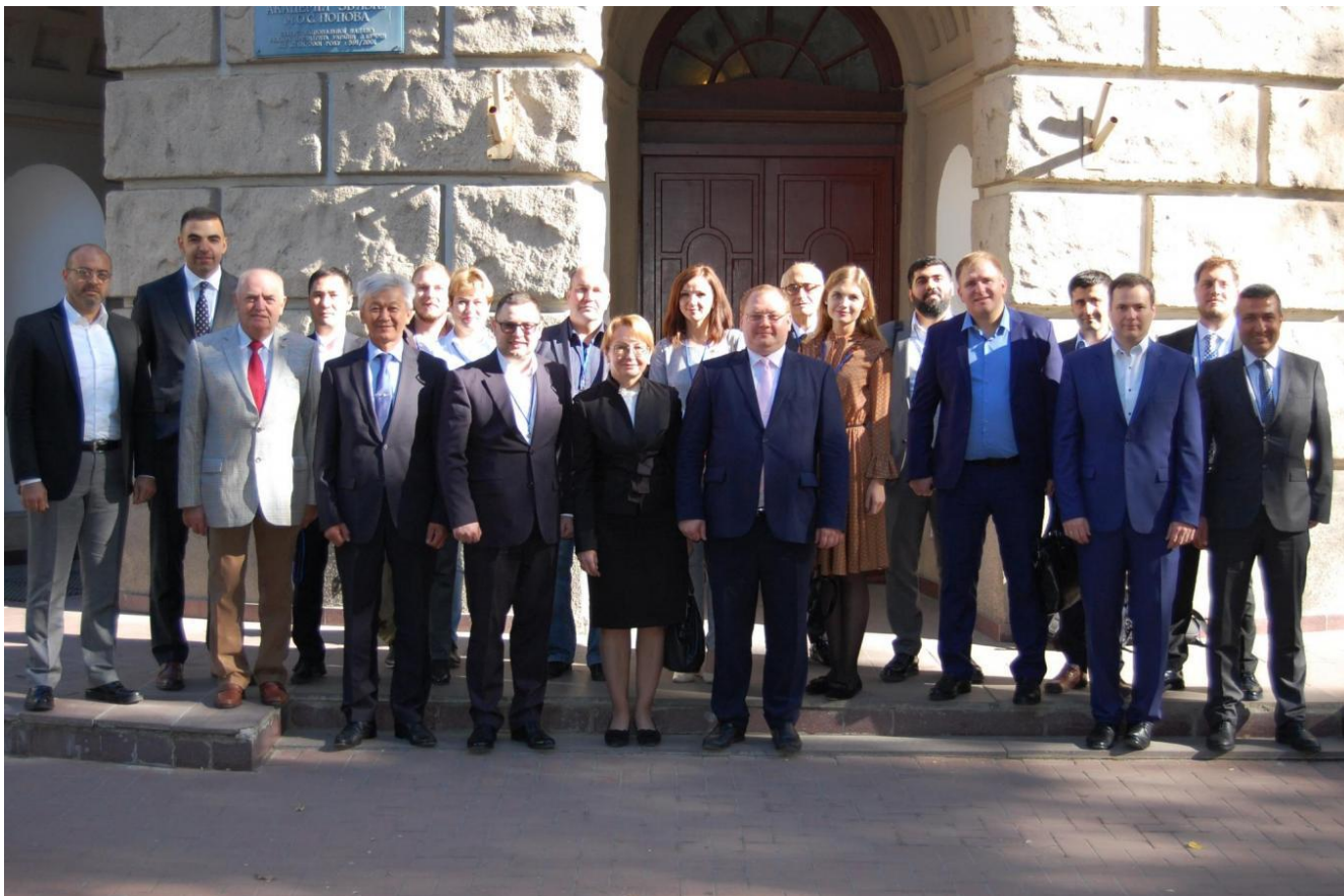
Коллективное фото участников семинара

В семинаре приняли участие более 40 человек , которые представляли 22 организации из 12 государств , а именно: Австрийской Республики, Республики Беларусь, Греции, Ирана, Кыргызской Республики, Республики Молдова, Словении, Соединённых Штатов Америки, Турции, Украины, Швейцарии и Японии.