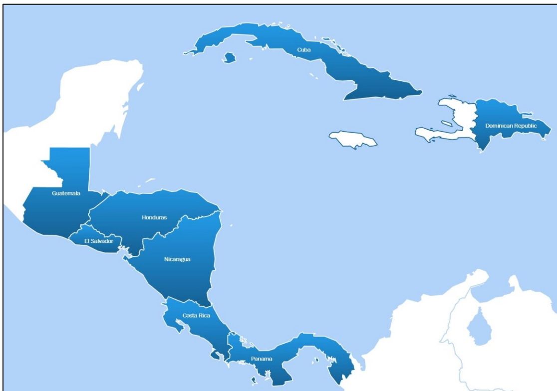
Figura 1. Mapa de países participantes de este estudio

Los países que se consideran parte de la América Central en este estudio se presentan a continuación