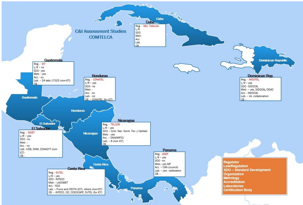
Figura 4. Resumen de las respuestas / país 13

La Figura 4 se presenta una ilustración de los resultados de la encuesta / país