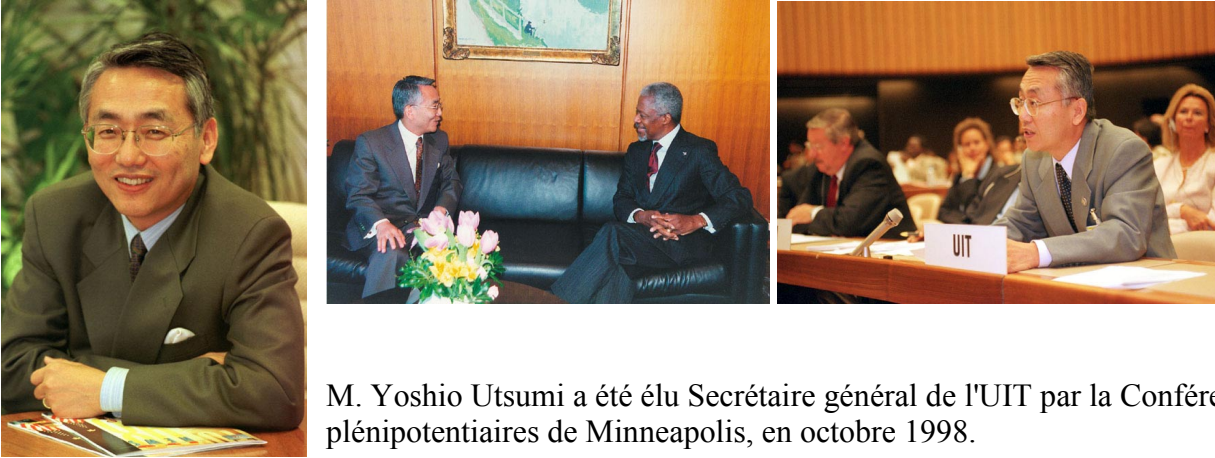
M. Yoshio Utsumi a été élu Secrétaire général de l'UIT par la Conférence de plénipotentiaires de Minneapolis, en octobre 1998.